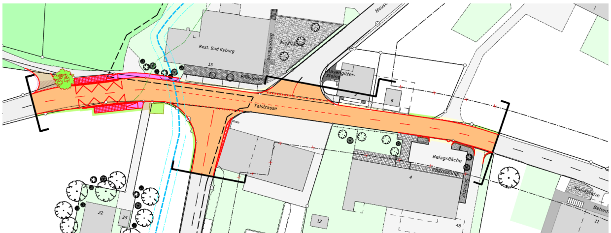
Abbildung 1, Ausschnitt Erschliessungsplan

Von Montag, 8. Juni 2026, bis November 2026 wird die Talstrasse im Abschnitt Ortsausgang West bis zur Liegenschaft Nr. 4 saniert. Gleichzeitig werden Werkleitungsarbeiten verschiedener Werke ausgeführt.