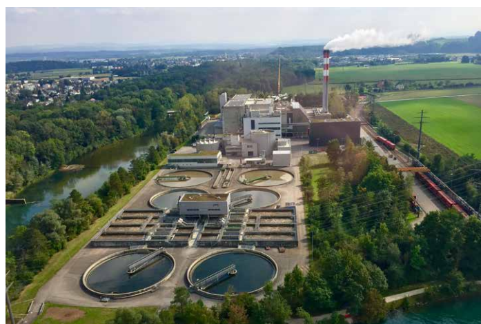
ARA Emmenspitz, Zuchwil